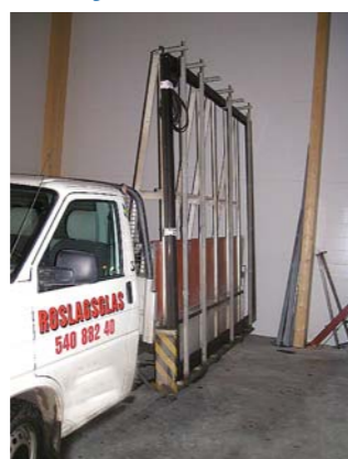
Bilarna kan köras in i hallen och lastas före leverans.