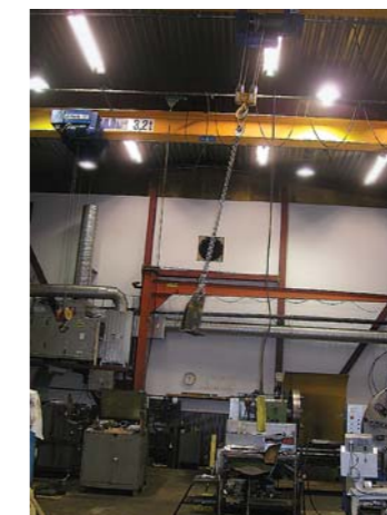
En 3,2 tons ABUS-travers och nedan en statorgavel till ABB.

IMS Maskinteknik använder ABUS-traverser sedan 1990. Företaget grundades 1976 och levererar bland annat statorgavlar till ABB. Totalt är man 23 anställda.